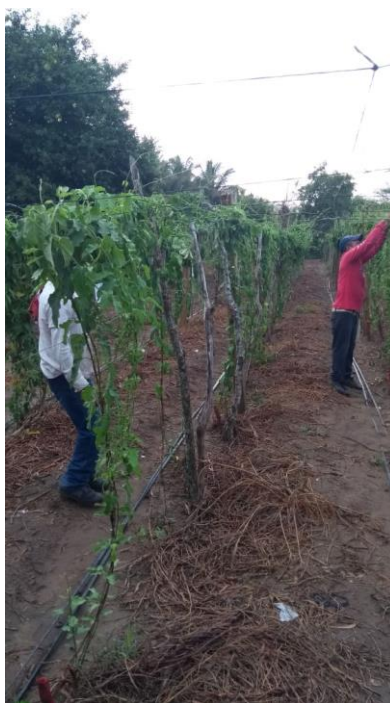
Figura 4. Soporte de pita utilizado para sostener las guías del cultivo del loroco.