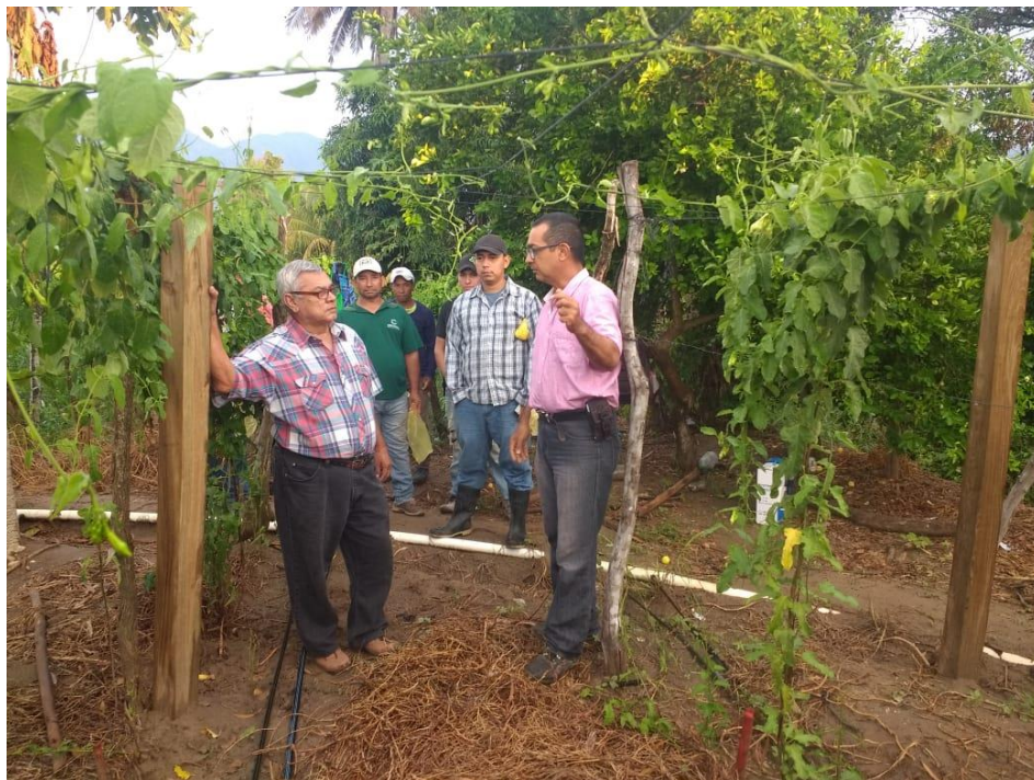
Figura 6. Supervisión del tutorado en el cultivo de loroco.