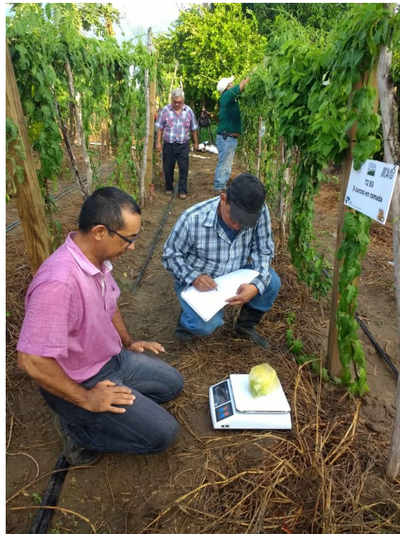
Figura 8. Pesado de la cosecha obtenida en cada parcela neta del cultivo de loroco.