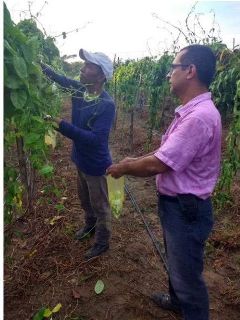
Figura 7. Cosecha del cultivo de loroco.