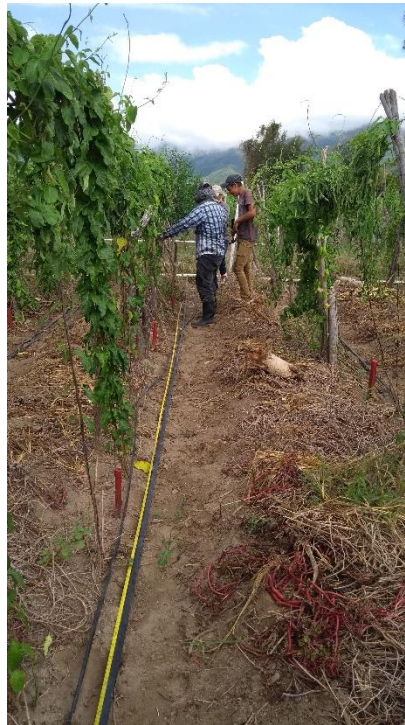
Figura 5. Delimitación de las subunidades experimentales dentro del área de ensayo.