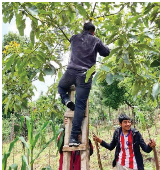
Figura 5. Desramado del árbol.

Para orientar la caída del árbol es mejor apoyarse con lazos que deben ser atados previamente al árbol y a medida que se tala se va tirando con fuerza al lugar seleccionado, con ello se evitará que el viento o el mismo peso de la copa lo dirija a otro lado (figura 5).