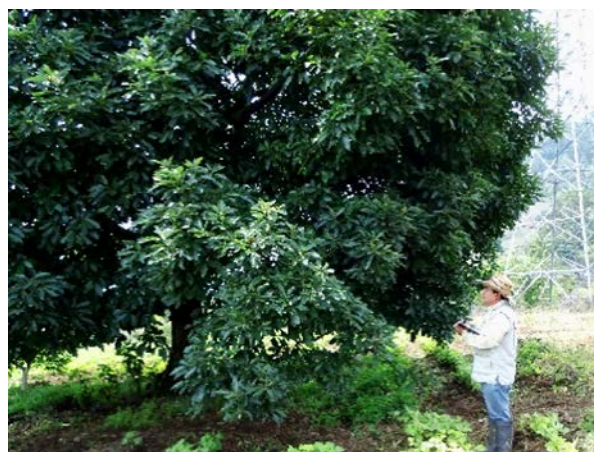
Figura 4. Árboles de aguacate nativos candidatos para renovación de copa.