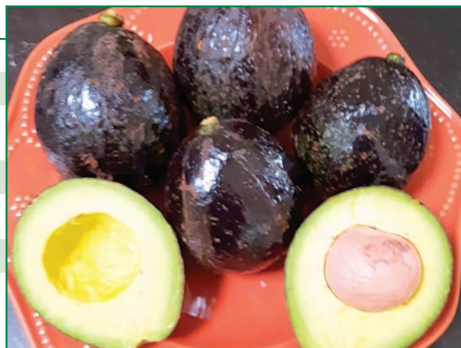
Figura 13. Fruto de la variedad de aguacate ICTA San Lucas.