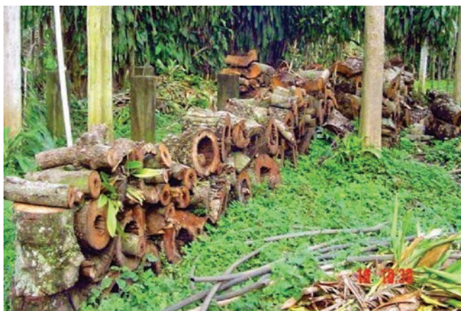
Figura 6. El uso de la motosierra permite trocear el árbol y hacer la leña.

Para talar el árbol es recomendable el uso de una motosierra, este equipo debe estar en perfecto estado de funcionamiento, para evitar contratiempos, esto permite además hacer la leña de una vez (figura 6). Si no se dispone de motosierra, los árboles pueden ser talados con hacha o algún tipo de sierra de arco, dependiendo del grosor del mismo.