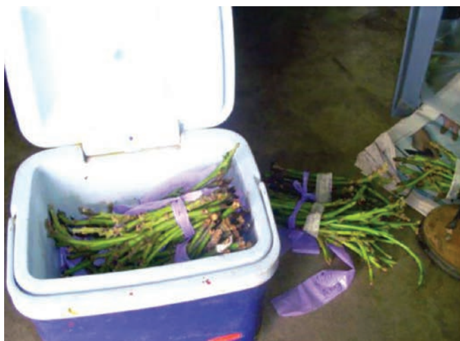
Figura 14. Protección de varetas.

dentro de recipientes con aislamiento, como neveras o hieleras. Las varetas deben envolverse con papel toalla o periódico húmedo, para evitar su deshidratación.