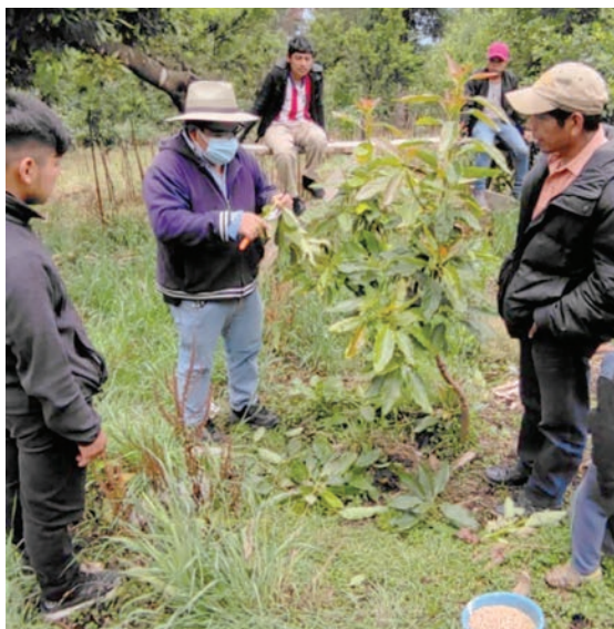
Figura 21. Poda de formación en aguacate. Algunas plantas la requieren desde el primer año del injerto.

Cuando el árbol esté bien desarrollado, debe manejarse la copa, de tal manera que se le dé la forma adecuada para que pueda sostener la producción más adelante. Esto puede suceder desde el primer año de injertado (figura 21).