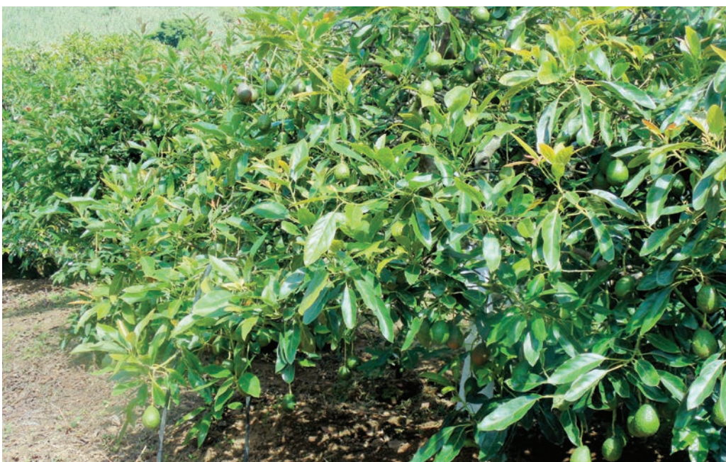
Figura 10. Árboles de aguacate Hass, que pueden ser sujetos para tomar varetas que se utilizarán en el injerto.

Cuando se cuenta con selecciones bien definidas, como las variedades promisorias identificadas por el ICTA, cuyos parámetros organolépticos de las frutas y fenológicos de la planta se conocen, se recomienda ver que éstos se adapten a las condiciones ambientales de la comunidad. El ICTA ha