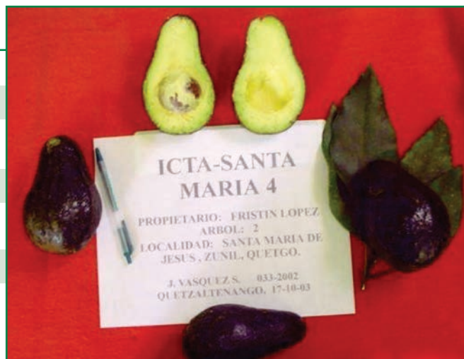
Figura 12. Fruto de la variedad de aguacate ICTA Santa María.

Para la zona del Altiplano, se recomienda la variedad ICTA San Lucas (figura 13). Las características y parámetros organolépticos de la fruta son: