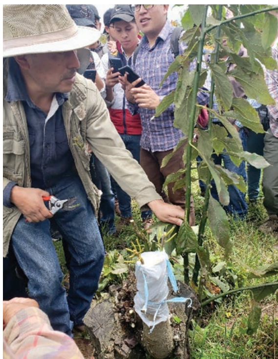
Figura 17. Despatronado de los árboles injertados; debe ser una práctica continua.