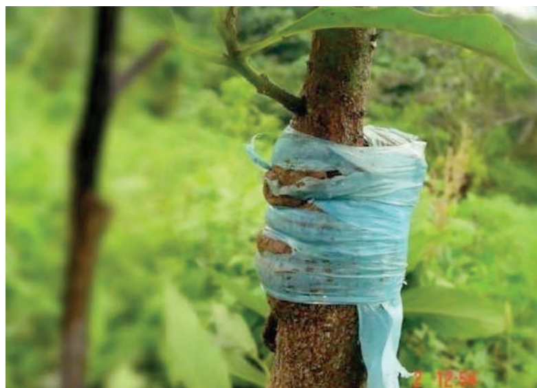
Figura 19. Aflojado de la venda del injerto.

de desvendado del injerto en un tiempo oportuno, da como resultado la formación de anillos que al final puede ser letal para el árbol recién formado (figura 19).