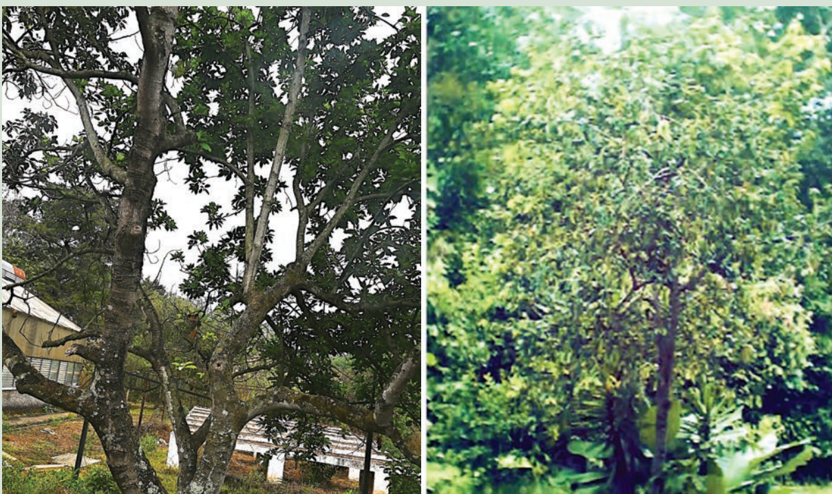
Figura 2. Árboles nativos de aguacate, sujetos para renovación de copa.

árboles dispersos de aguacate nativo que los agricultores dejan en sus terrenos, pero pasados 10 o 15 años no entran en producción. Estos árboles también deben ser destinados para la renovación de copa., (figura 3).