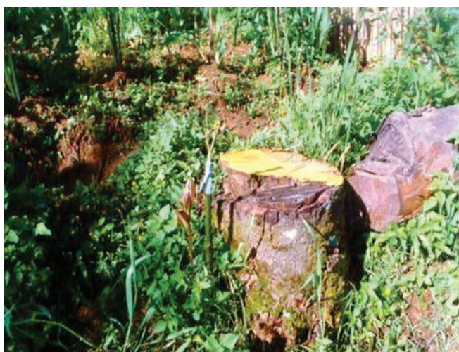
Figura 8. Estado del tocón luego de haberse protegido con pintura.

ningún tipo de daño por la caída del árbol. Debe cubrirse con pintura de aceite o cubre corte para protegerlo y que el rebrote de los hijuelos sea saludable, lo cual sucede entre tres a cuatro meses después, dependiendo del clima.