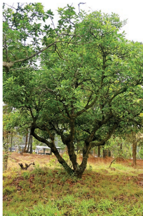
Figura 3. Árboles dispersos e improductivos.