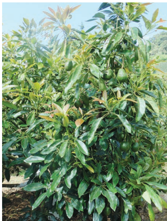
Figura 1. Manejo de porte bajo en árboles de aguacate.