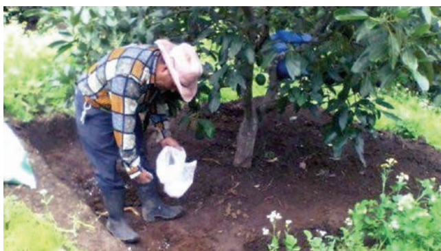
Figura 22. Aplicación de fertilizante.

con 250 gramos de la fórmula 15-15-15 por año, y a partir del sexto año, incrementar un 10 a 15% anualmente, dependiendo de la respuesta de la planta. Lo ideal es realizar un muestreo de suelos y seguir las indicaciones técnicas que se den a partir de los resultados del análisis (figura 22).