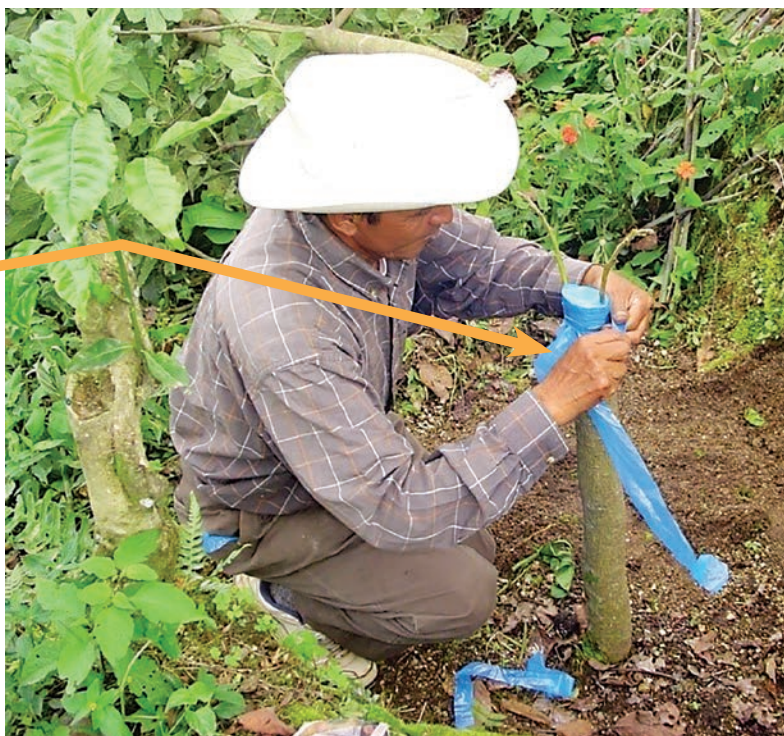
Figura 16. Injerto de corona, se utiliza para árboles con diámetro mayor.