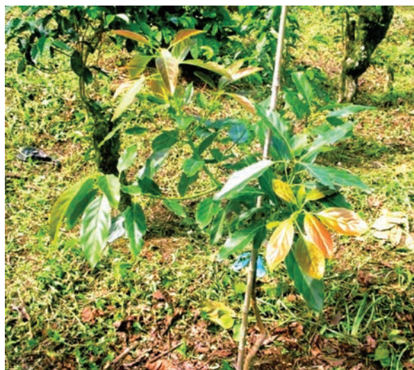
Figura 18. Tutoreo en árbol de aguacate.

Esta práctica es importante para que el injerto pueda sostenerse y se evita con ello que el viento o los animales lo quiebren. Los tutores pueden ser de madera, plástico o metal (figura 18).