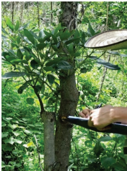
Figura 9. Árboles jóvenes injertados, tal como se encuentran en el campo.