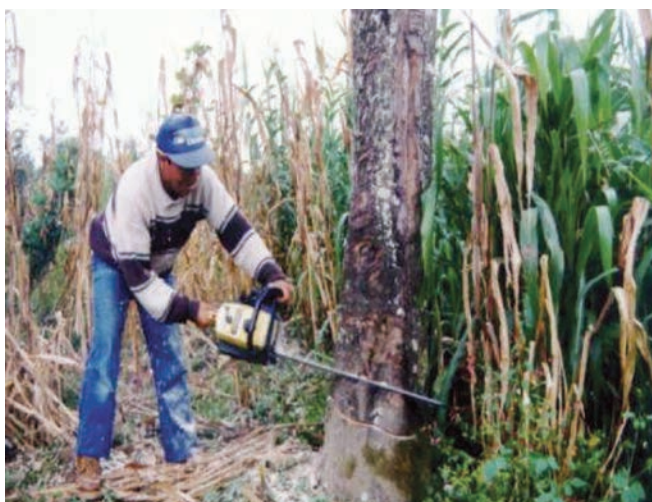
Figura 7. Haciendo la cama para el corte del árbol.

de encuentro del corte oblicuo, con ello queda hecha la cama del árbol, esto facilitará determinar la dirección a donde queremos que caiga el árbol (figura 7).